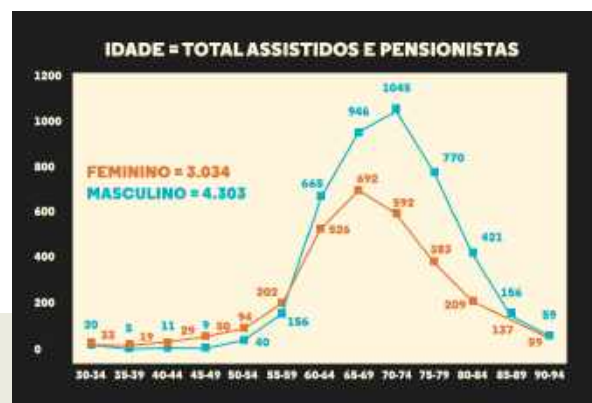
Figura 2. Número de participantes por Idade e Sexo

S alienta-se que, na faixa etária mais elevada, encontram-se 118 participantes, tendo alguns quase 100 anos.